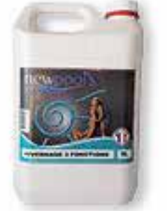
Hivernage 3 fonctions Algicide, bactéricide, anticalcaire