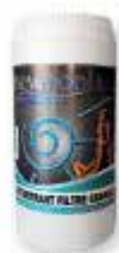
Détartrant filtre Granulés