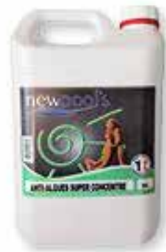
Anti-algues super concentré Algicide, bactéricide