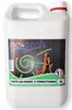
Anti-algues 3 fonctions Algicide, bactéricide, anticalcaire