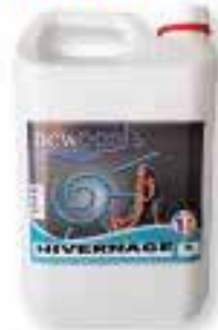
Hivernage Algicide, bactéricide