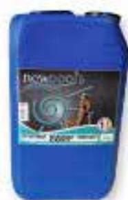
Détartrant, Dégraissant, Rénovant concentré Pour bassin, plage, dallage, toiture, bâche PVC, alu. A diluer