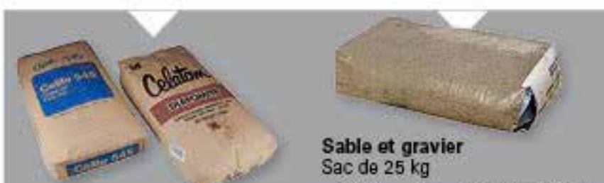
Sable et gravier Sac de 25 kg