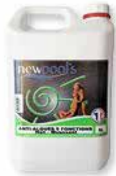
Anti-algues 5 fonctions Non moussant Algicide, bactéricide, anticalcaire, floculant, clarifiant