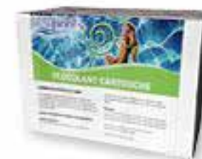
Floculant cartouche Boîte 8 cartouches 1 kg