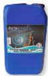
Détartrant, dégraissant, bactéricide, désoxydant, désinfectant Aspect huileux spécial surfaces verticales. N'attaque pas les pièces métalliques. Pour bassin / plage / sanitaire