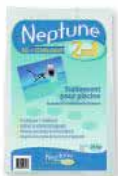
Sel piscine NEPTUNE 2 en 1, Sel stabilisé Pastilles