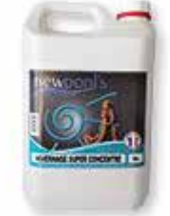
Hivernage super concentré Algicide, bactéricide