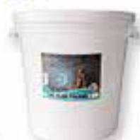
TAC Plus Poudre