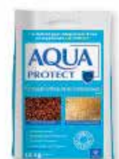
Sel adoucisseur AQUA PROTECT Pastille Agent actif O'PROTECT