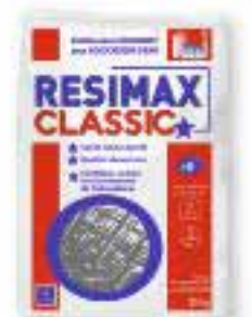
Sel adoucisseur RESIMAX Pastille 12/24