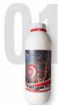
Nettoyant ligne d'eau Dégraissant