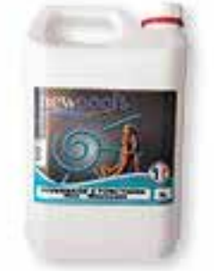
Hivernage 5 fonctions Non moussant algicide, bactéricide, anticalcaire, floculant, clarifiant