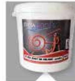
Stabilisateur de chlore Poudre