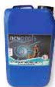
Détergent neutre désinfectant concentré. Nettoyant dégraissant, bactéricide et fongicide. Pour plage et sanitaire. A diluer.