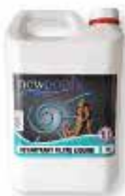
Détartrant filtre Liquide