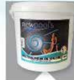
Neutraliseur de chlore Granulés