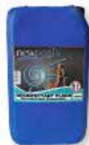
Désinfectant plage désodorisant concentré. Désinfectant, fongicide, désodorisant. Pour plage et sanitaire. A diluer.