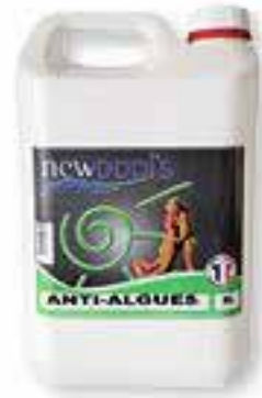
Anti-algues Algicide, bactéricide