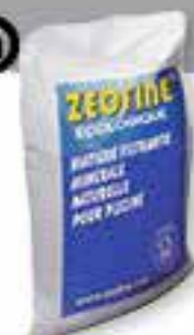
Zéofine Sac de 19 kg

19 kg de Zéofine est équivalent à 25 kg de sable