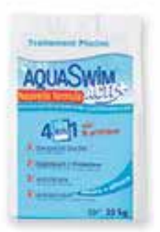
Sel piscine AQUA SWIM Acti+ 4 en 1 (sel, stabilisant, anti-calcaire, anti-corrosion)