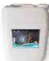
Stop-calcaire inhibiteur de métaux