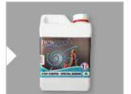
Stop guêpes Spécial bassin, 2 L pour 50 m 3